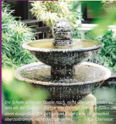
Die Schale ahmt die Quelle nach, nicht überströmender zu sein als die Quelle... Dürfte das Gleiche! Zuerst anfüllen und dann ausgießen. Die gütige und kluge Liebe ist gewohnt überzuströmen, nicht auszuströmen... B.v. Clairvaux

Die Teilnahme ist gebührenfrei. Die Kosten übernimmt die Diakonische Bezirksstelle Weinsberg