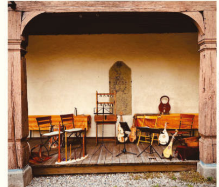
Rückblick 2025: Bühnenaufbau nimmersächlich