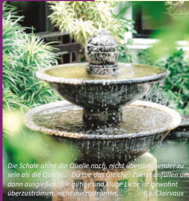
Die Schale ahmt die Quelle nach, nicht überströmender zu sein als die Quelle... Dürfte das Gleich! Zuerst anfüllen und dann ausgießen. Die gütige und kluge Liebe ist gewohnt überzuströmen, nicht auszuströmen... B.v. Clairvaux

Die Teilnahme ist gebührenfrei. Die Kosten übernimmt die Diakonische Bezirksstelle Weinsberg