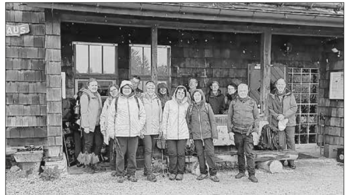
Gruppenbild beim Franz-Keller-Haus

Anspruchsvoll und abwechslungsreich ist der längste der Löwenpfade: die „Heldentour“ in Lauterstein-Nenningen. Mit knapp 24 Kilometern und fast 800 Höhenmetern stand hier vor allem die sportliche Herausforderung im Fokus. Uns boten sich aber auch wunderschöne Ausblicke und typische Alblandschaften. Die Tour führte uns rund um den Heldenberg, den Namensgeber der Tour. Gestartet sind wir vom Wanderparkplatz Heldenberg. Wir durchquerten wildromantische Waldabschnitte und idyllische Wacholderheiden. Nach kurzer Rast bei der Reiterleskapelle ging es von dort bergauf zum Kalten Feld, wo wir eine Vesperpause im gemütlichen und eingeeheizten Gasträum des Franz-Keller-Hauses machten.