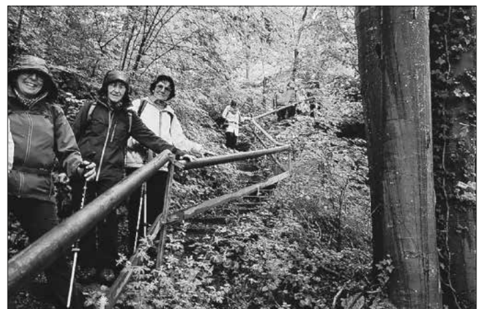
Hinab ins Tal nach Degenfeld

Gestärkt wanderten wir auf schmalen Pfaden am Albtrauf entlang bis zum Galgenberg. Von hier bot sich uns eine fantastische Aussicht über Nenningen hinweg ins Lautertal bis hin zum Filstal. Weiter entlang der Kante, bis sich der Weg hinab nach Degenfeld schlängelte. Teilweise ging es dabei über etwas rutschige und steile Stufen hinab.