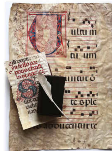
Sonderausstellung im GH-Museum Wüstenrot 2025:

„Feder, Farbe, Druckerschwärze – von Buchmalerei zu Buchdruck um 1500“