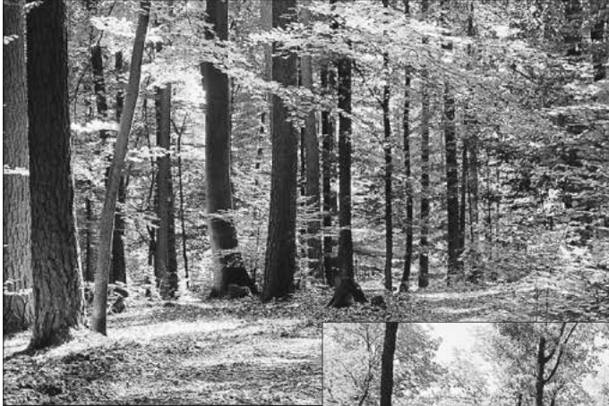
Weg durch die Waldruh