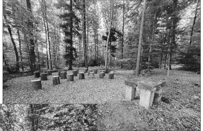
Andachtsplatz in der Waldruh Schwäbischer Wald