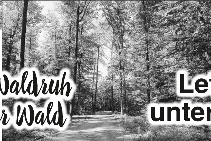
Forstweg durch die Waldruh