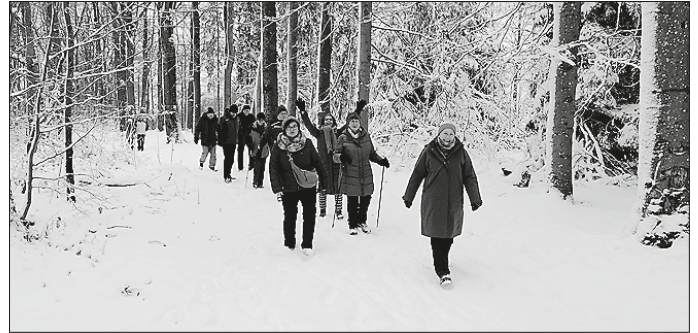
Wanderung im Pulverschnee

Stangenbach. Ab hier wurde es etwas sportlich, galt es doch den Anstieg hinauf zum Greuthof zu bewältigen. Oben angekommen, ging es wieder in den verschneiten Wald, bis hinunter ins Joachimstal. Ab hier musste ein kleines Stück entlang der Straße über Altlautern bis zur Lohmühle gegangen werden. Ab der Lohmühle ging es dann wieder auf teilweise sehr schmalen Pfaden und etwas steil zwischen schneebedeckten Bäumen hinauf in Richtung Wellingtonien und zum Ausgangspunkt der Wanderung. Durch den Pulverschnee und die trockene Kälte war es eine im wahrsten Sinn des Wortes sehr schöne Winterwanderung.