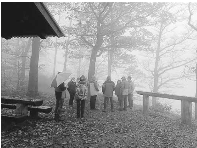
Beim Aussichtspunkt Paradies

Trotz regnerischen und nebelverhangenen Wetters fanden sich 15 unverzagte und gut gelaunte Wanderinnen und Wanderer beim Treffpunkt am Marktplatz in Neuhütten ein. In Fahrgemeinschaften ging es zum Start der Wanderung nach Weiler. Durch herbstlich gefärbte Weinberge und Wälder führte uns die Strecke hinauf zum Aussichtspunkt im Gewinn Paradies.