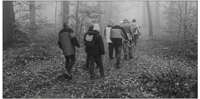
Wanderung im herbstlichen Wald

Weiter ging es auf Waldpfaden durch den aufgrund des Nebels fast schon magisch anmutenden Wald zum Grill- und Rastplatz Zigeunerfohrle. Von dort über Eichelberg zurück zum Start der Wanderung bei der Sternboutique in Weiler. Trotz oder gerade wegen des teilweise dichten Nebels war es eine schöne und kurzweilige Wanderung. Die Schlusseinkehr fand bei gutem Essen und in geselliger Runde in einer Gaststätte in Weiler statt.